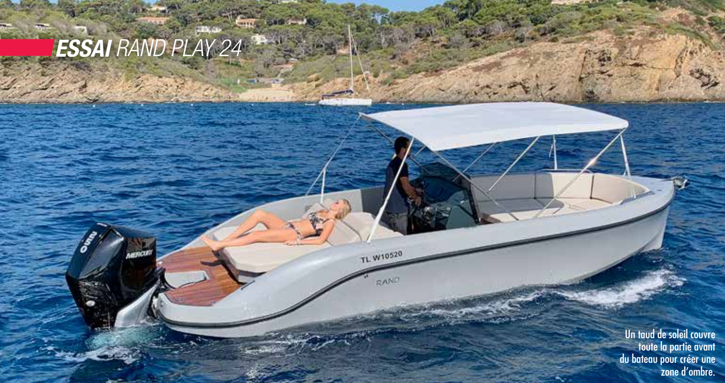
Un taud de soleil couvre toute la partie avant du bateau pour créer une zone d'ombre.