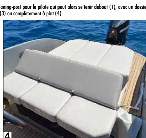
Le dossier du bain de soleil offre pas moins de quatre positions : façon leaning-post pour le pilote qui peut alors se tenir debout (1), avec un dossier droit pour piloter assis (2), avec un dossier pour une position de lecture (3) ou complètement à plat (4).