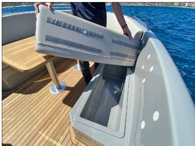
Simple à mettre en place ou à retirer, les assises et dossiers des coffres sont tous fixés par des Velcro.