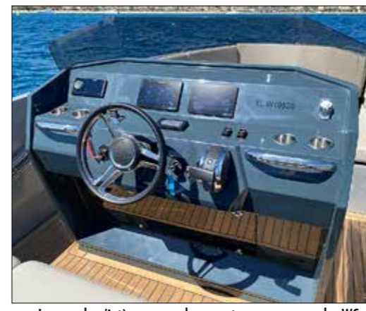
La console n'intègre aucun logement ou espace pour les WC, mais elle contient des coffres dans sa partie basse.