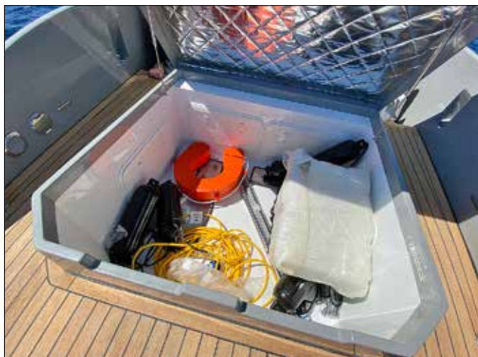
La grande soute qui accueille le moteur sur la version in-bord est ici laissée libre et contient un bel espace pour le rangement du matériel.