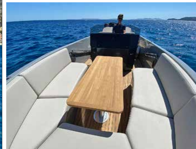
La table du carré avant peut s'abaisser au moyen de deux pieds plus courts, et former un bain de soleil, une fois les coussins posés sur le teck.