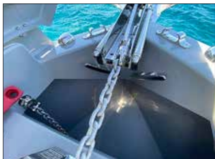
Les taquets sont un peu bas et leur accès manque de praticité, en raison de la proximité du davier.